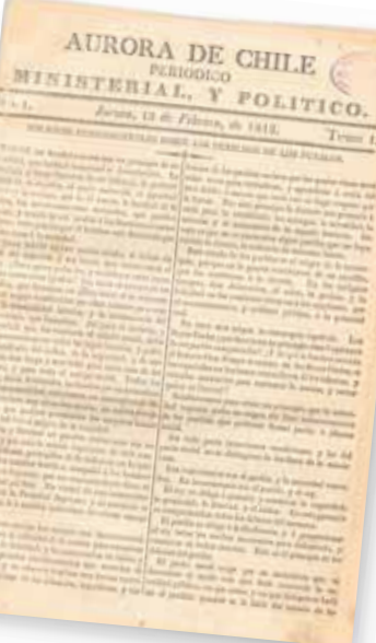
BIBLIOTECA NACIONAL DE CHILE